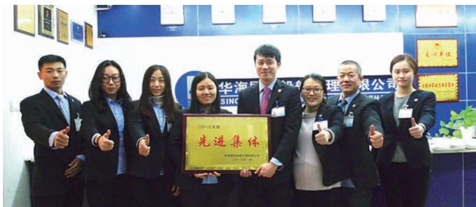
日照公司货代部部分员工